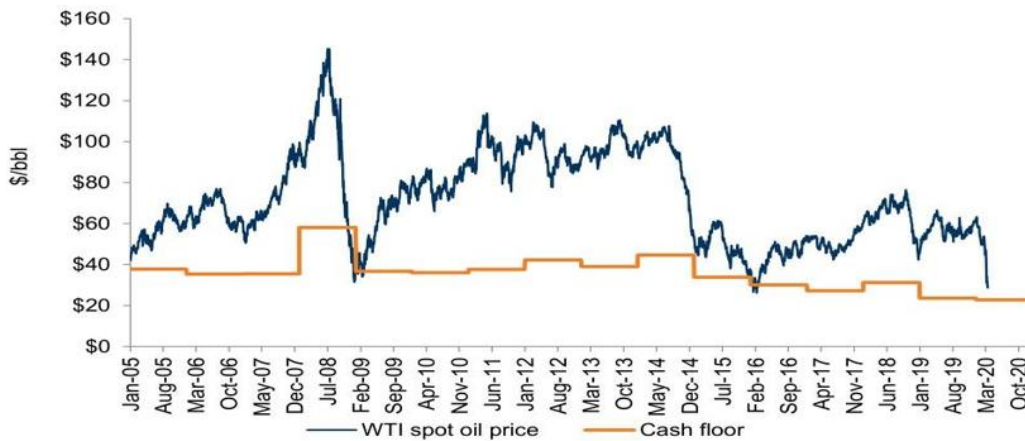
图表1 原油价格及原油现金成本

虽然这篇专题报告主要回顾一周前的思考，却依然不失亮色。因为这个观点在当下依然适用——比如，应该因为价格跌破现金成本而抄底原油吗？